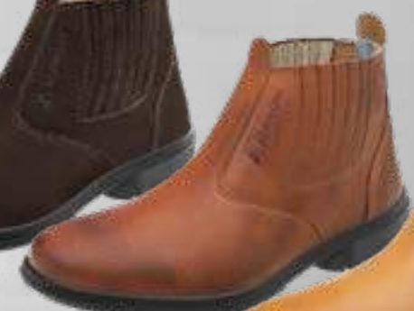
55AG19 EC LP