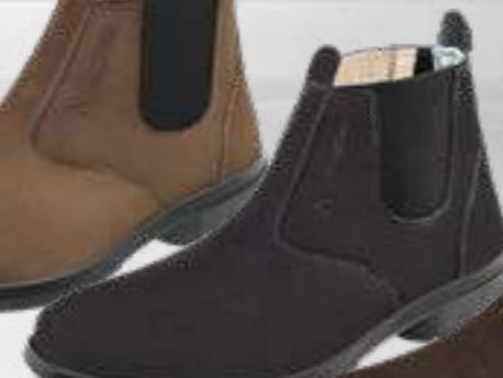
55AG19 EA NP