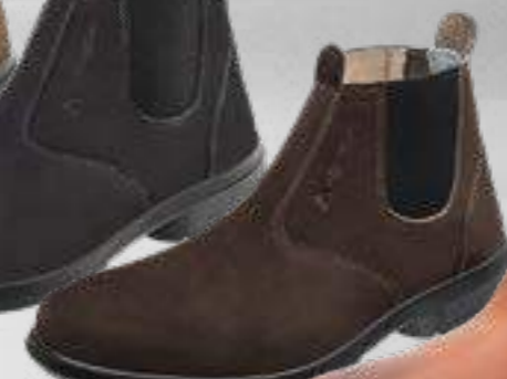
55AG19 EA NCE