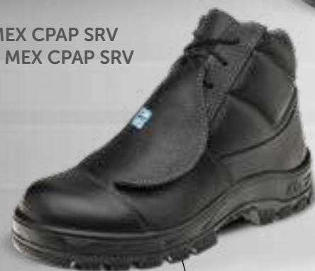
50B29 MEX CPAP SRV 60B29 MEX CPAP SRV