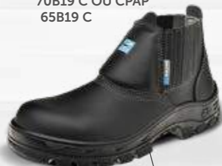
50B19 C OU CPAP 60B19 C OU CPAP 30B19 C OU CPAP* 70B19 C OU CPAP 65B19 C