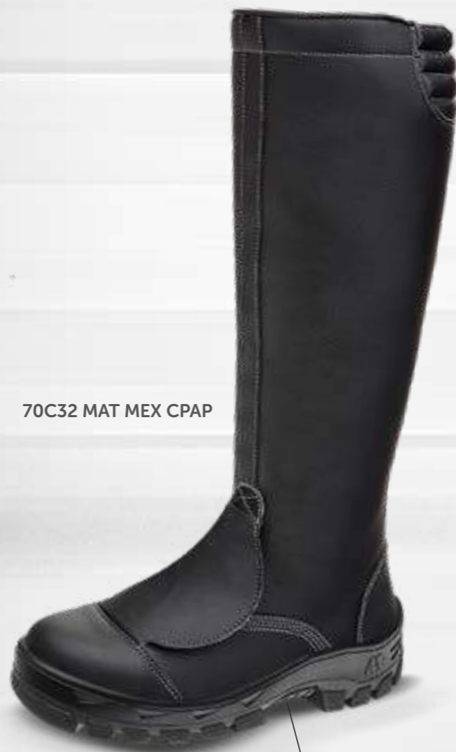
70C32 MAT MEX CPAP