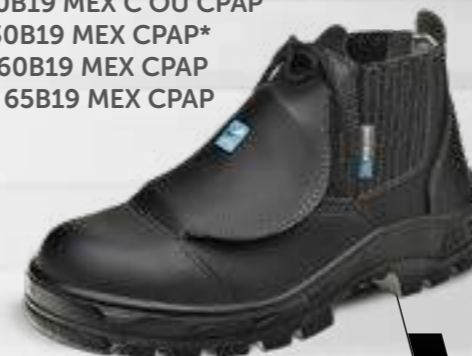
50B19 MEX C OU CPAP 70B19 MEX C OU CPAP 30B19 MEX CPAP* 60B19 MEX CPAP 65B19 MEX CPAP