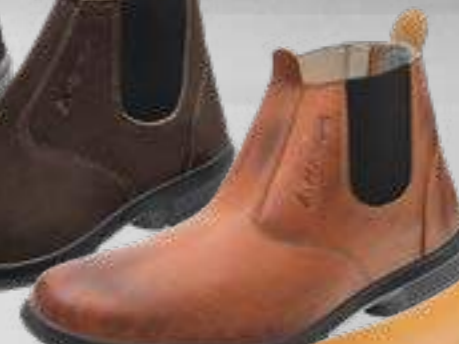
55AG19 EA LP