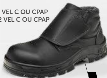
50B22 VEL C OU CPAP 70B22 VEL C OU CPAP