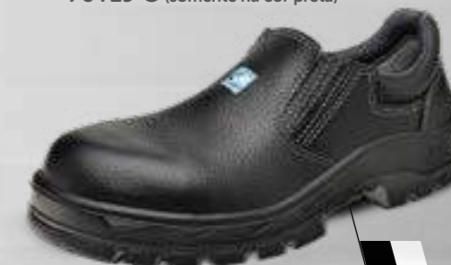
50T19 C OU CPAP 70T19 C (somente na cor preta)