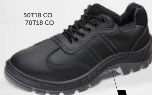
50T18 CO 70T18 CO