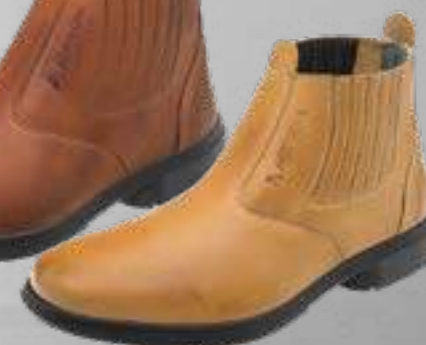
55AG19 EC LC