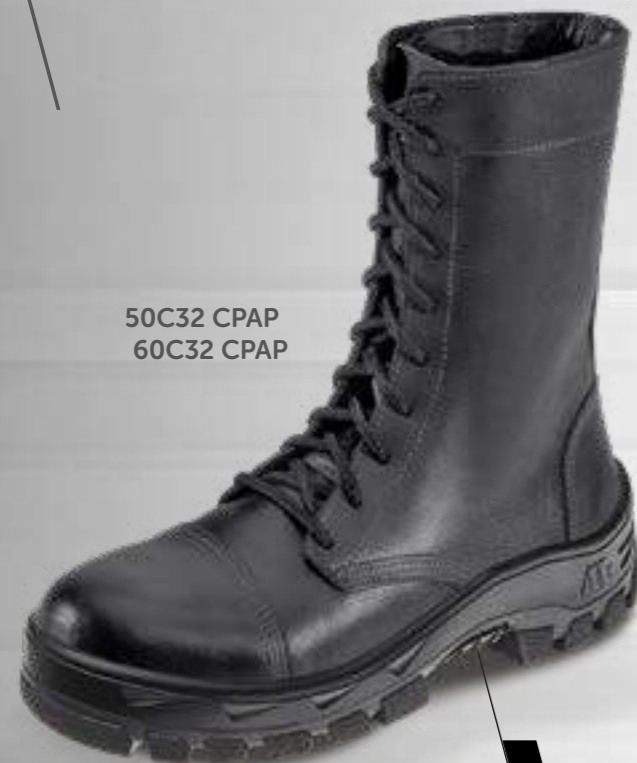
50C32 CPAP 60C32 CPAP