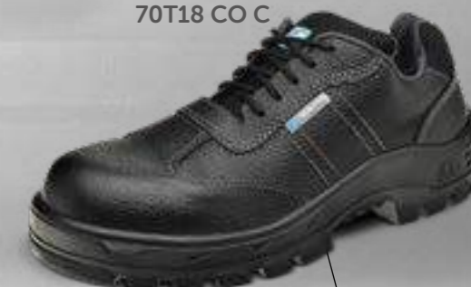
50T18 CO C 70T18 CO C