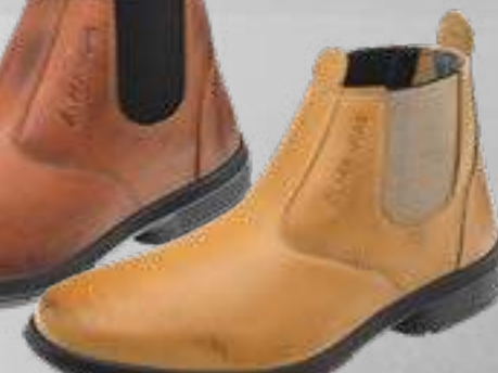
55AG19 EA LC